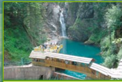
Centrale elettrica idrosolare d'esposizione con il lago di Valentin