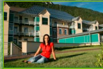
Ospedale Laas energeticamente autonomo