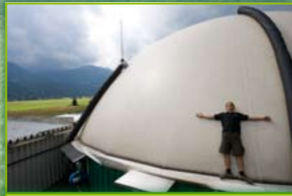
Impianto di biogas Würmlach