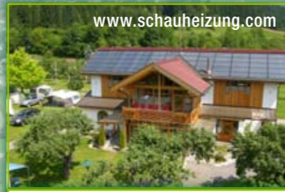
Virtuale centrale termica a biomassa Alpencamp