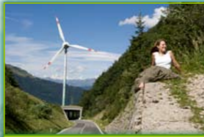
Turbina eolica al passo Monte Croce Carnico