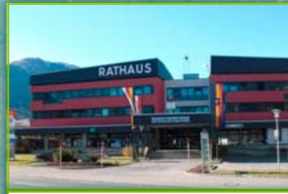
Municipio con l' Infopoint