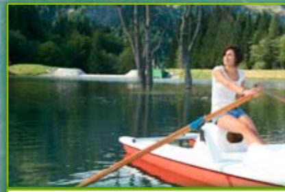
Lago artificiale ecologico Cellon